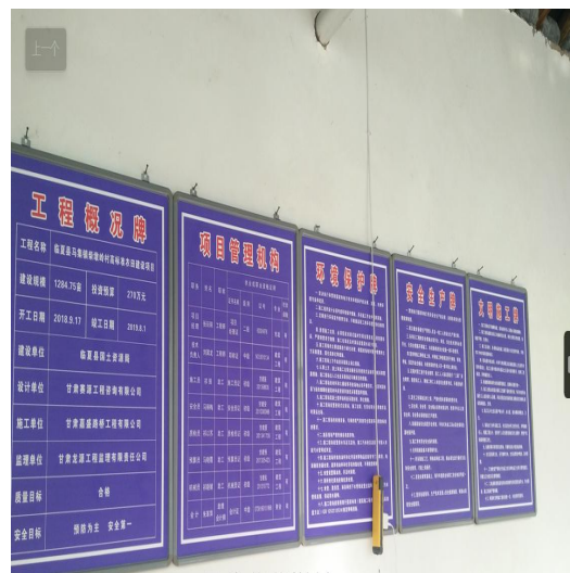
施工期环境保护制度